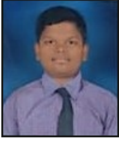
वेदांत वि. राजत ९४.८० टक्के