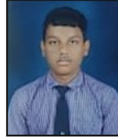
संस्कार व. कामडी ९२.०० टक्के