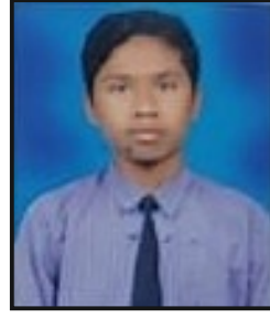
मुन्ना हो. वकेकार ९२.०० टक्के