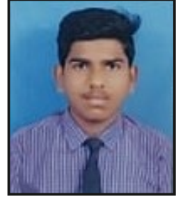
साईनाथ भा. आत्राम ९०.२० टक्के